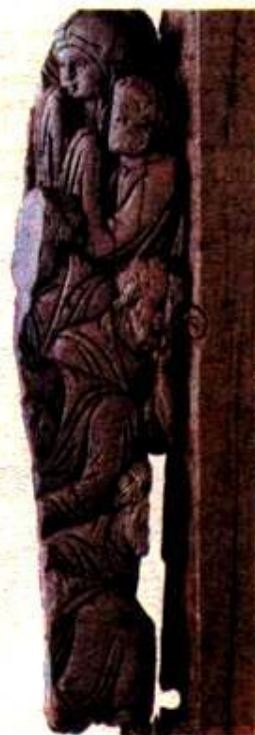
Част от църковна украса от слонова кост, която изобразява Успение Богородично (Смъртта на Света Богородица). Открита е във Велико Търново