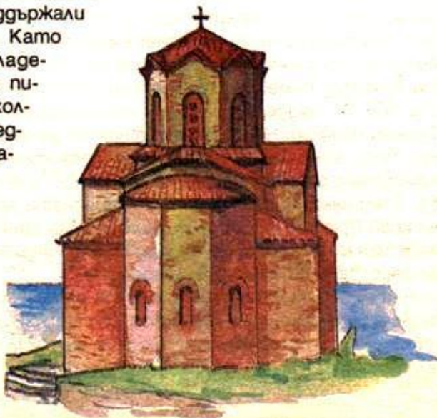
Външен вид на църквата „Св. Йоан Канео“ на Охридското езеро

АПОКРИФИТЕ станали особено популярни в тези трудни времена. Така наричали тайните книги, които били забранени от църквата, макар че имали религиозен характер. В тях читателят откривал неща, за които не пишело в официалните църковни книги. Можел да узнае повече за слънцето и земята, кой е измерил латинската, гръцката и българската писменост. От някои апокрифи българинът научавал подробности за своето свободно и славно минало. Често разказаното било неточно и преувеличено. Българските царе били описвани като безкрайно мъдри и щедри към народа си. Годишният данък при цар Симеон уж бил „едно повесмо*, лъжица масло и едно яйце“, а за времето на цар Петър пишело, че „имаше изобилие от всичко... и нямаше оскъдност* от нищо“. Тези поукрасени редове поддържали духа на българина. Като слабели своите владетели, българските писатели изтъквали колко тежка и несправедлива е византийската власт.